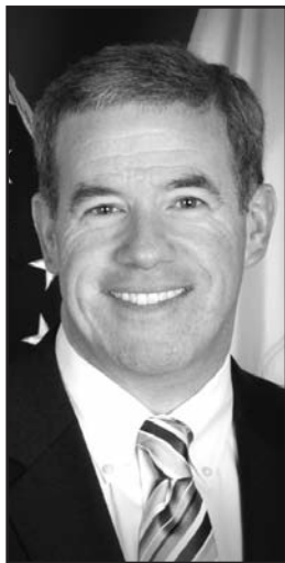
Fiscal General Jeffrey S. Chiesa

“Estamos en la fase de recuperación, y se espera que la mayor parte de las quejas se enfocan ahora en las estafas de reparación de viviendas. No importa qué tan urgente sea su necesidad de reparaciones, es absolutamente importante dar un paso atrás y aprender todo lo que pueda acerca de cualquier contratista - especialmente si tocan