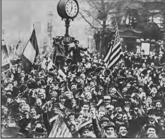
Imagen de la primera parada "día del armisticio" en 1919-

Final de la Primera Guerra Mundial cuando la suspensión de hostilidades se aplicó a las 11 de la mañana del 11 de noviembre: "undécima hora del undécimo día del undécimo mes"