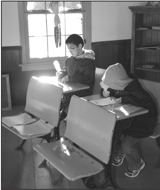
Los textos o escritos de la época colonial fueron hechos con una pluma y tintero, tal como estos niños aprendieron durante el programa "Cuatro Siglos en un Fin de Semana".

"Cuatro Siglos en un Fin de Semana" se celebra en todo el condado de Union, en 27 sitios históricos diferentes. El Departamento de Parques y Recreación de dicho condado realizará el evento en la aldea abandonada Watchung Reservation, donde habrá juegos y actividades para niños, paseos en carruajes, así como recorridos históricos por la