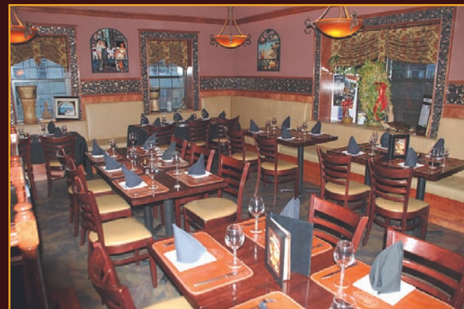
Confortable comedor con la mejor atención.