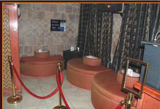
Nuestro salón VIP para su disfrute en privacidad.