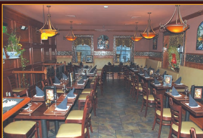
Amplio y acogedor salón comedor.