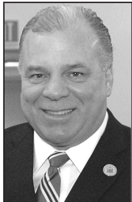
SEN. S. SWEENEY

"Las inversiones ponen a la gente a trabajar, proporcionan educación, hacen a las universidades asequibles. Las inversiones reconstruyen nuestra red de transporte, restauran los barrios con problemas, desarrollan nuevas industrias, y ayudan en el crecimiento de los negocios".