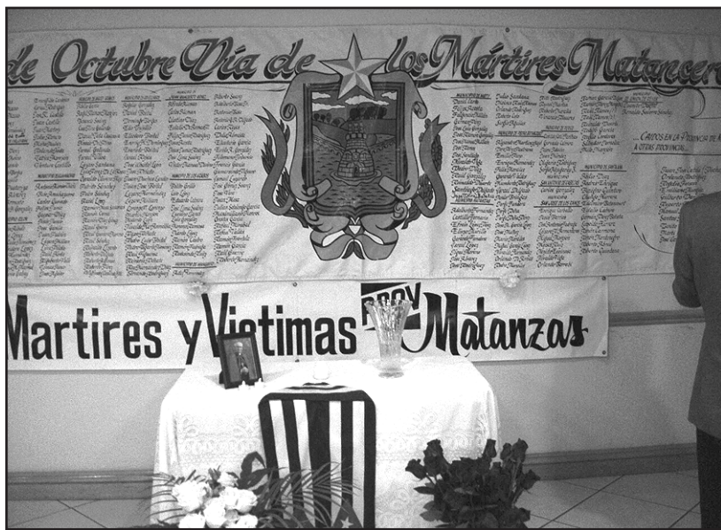
Un aspecto gráfico del Mural a los Mártires de la Provincia de Matanzas, instalado en los Municipios de Cuba en el Exilio. (Foto de La Voz).