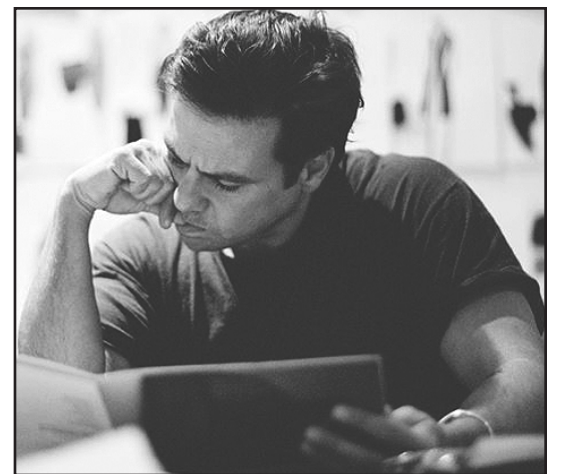
Narciso Rodríguez en su atelier.

Nueva York, colabora con Anne Klein bajo Donna Karan y luego de eso llega a Calvin Klein donde trabajó en la colección para damas. En 1995, Rodríguez se convirtió en el director de diseño de TSE, donde presentó en Nueva York sus primeras colecciones de ropa creada para damas y caballeros. Simultáneamente, Rodríguez fue nombrado director de diseño de Cerruti en Paris. En 1996, Rodríguez recibe aclamación internacional al diseñar el vestido de novias que Carolyn Bessette lució cuando contrajo nupcias con