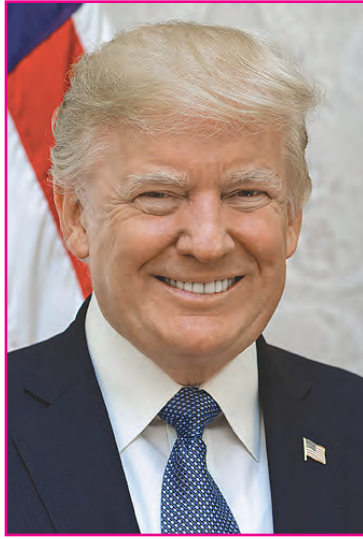
Donald J. Trump