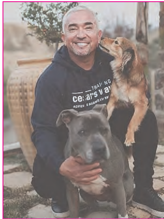
"Better Human, Better Dog", con César Millán

Cesar cree que nunca debemos trabajar con-