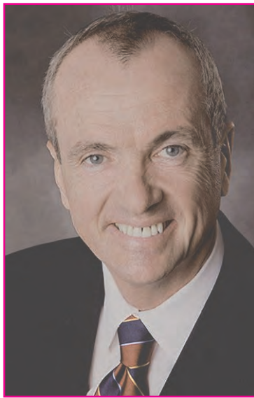
Gobernador Phil Murphy

La contienda por la gobernación de Nueva Jersey se intensifica entre el actual gobernador Phil Murphy y su contrincante el empresario republicano Jack Ciattarelli, hasta el momento Murphy goza de una ventaja en las encuestas aunque los observadores indican que es muy temprano para determinar favoritos y notan que nunca antes en la historia un gobernador demócrata ha sido reelecto en New Jersey. Todo estará más claro después de un debate programado para el Martes 28 de Septiembre, 7pm