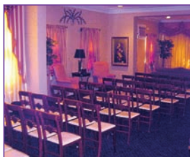
Capilla amplia y confortable