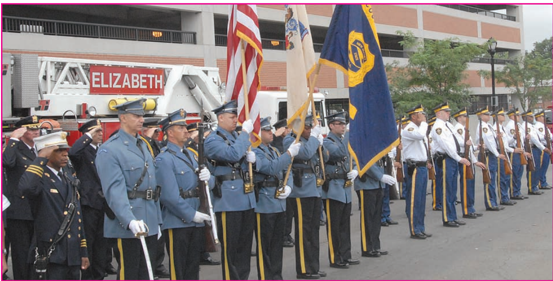
Guardia de Honor de los cuerpos de Policía y Bomberos de la ciudad de Elizabeth y el Condado de Union.