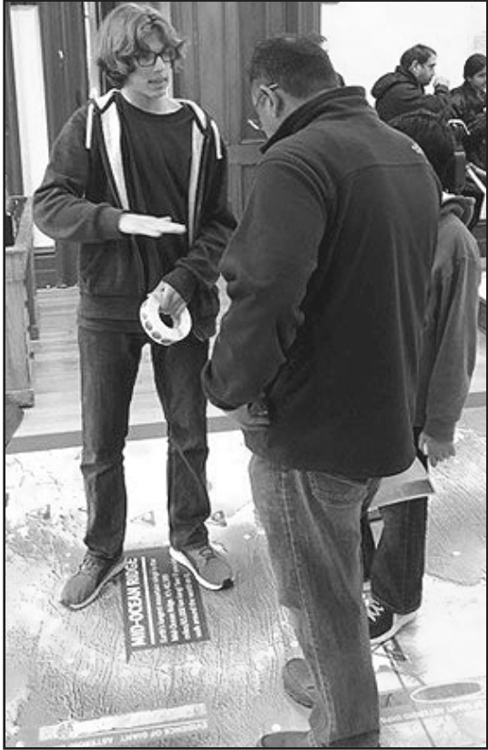
Nuevo miembro del 4-H Club en una de las actividades de la organización.

El programa 4-H del condado de Union fun-