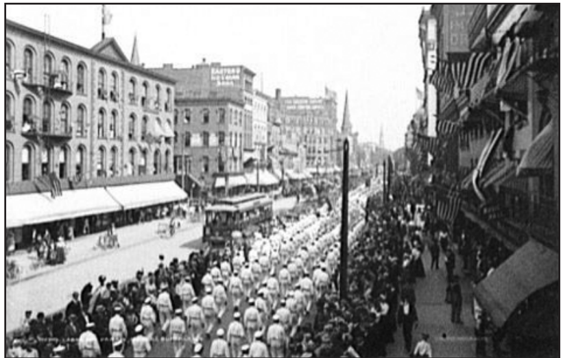
Parada del Día del Trabajador en Main St., Buffalo, N.Y. en 1900

Igualmente Canadá se unió conmemorando el Día del Trabajador en el mes de septiembre a partir de 1894, al mismo tiempo que el Congreso norteamericano lo establecía oficialmente como día festivo nacional.