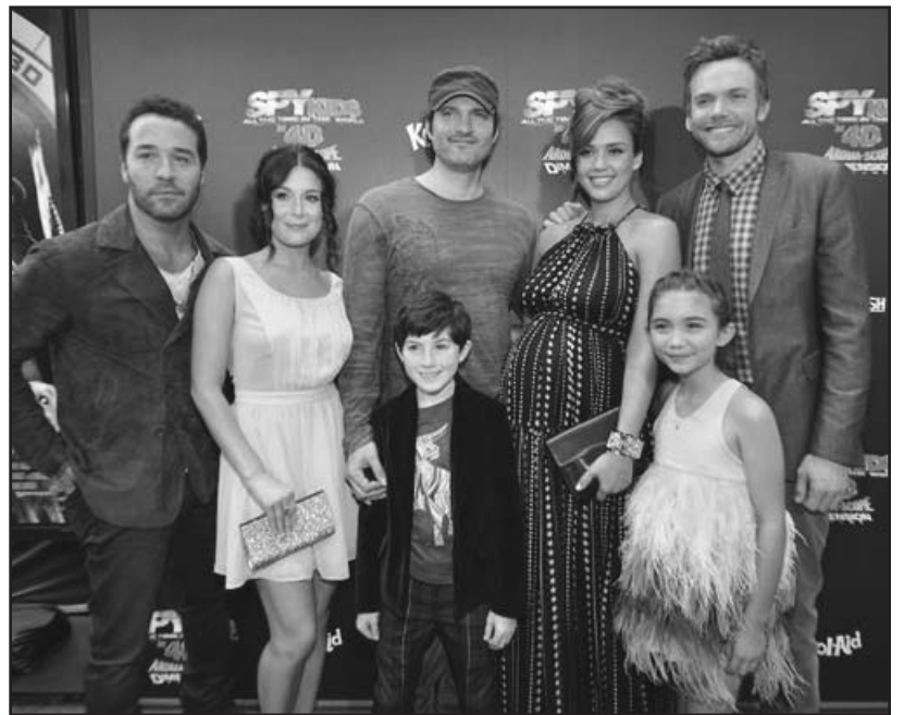
El "cast" y director de la película durante su estreno: Jeremy Piven, Alexa Vega, Robert Rodríguez, Jessica Alba, Joel McHale, Mason Cook y Roan Blanchard.

Si bien se dio a conocer con filmes de acción para adultos como "Desperado" o "From Dusk Till Dawn", en 2001 nos sorprendió con una comedia de acción infantil que contaba la historia de una pareja de hermanos y su misión por salvar al mundo en "Spy Kids". A diez años del lanzamiento de la película, Dimension Films estrena el 19 de agosto la cuarta entrega de esta serie, "Spy Kids: All the Time in the World", protagonizada por Jessica Alba y los jóvenes Rowan Blanchard y Mason Cook. En esta oportunidad, la película gira en torno a los mellizos Rebeca (Blanchard) y Cecil (Cook) y la tensa relación que llevan con su madrastra Marissa Cortez Wilson (Alba). Sin embargo, tras descubrir que Marissa es en realidad una ex espía internacional que debe-