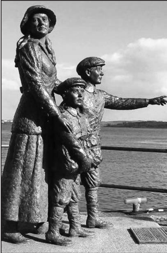
Estatua de Annie Moore, una niña irlandesa de 15 años, acompañada de sus hermanos, en Ellis Island.

datos dedicado al recuerdo de aquella época, la inmigración masiva de los siglos XIX y XX; pero sin duda alguna la nota mas interesante es la de Annie Moore, una niña irlandesa de 15 años, acompañada de sus hermanos, porque pasó a la historia el 2 de enero de 1892 al convertirse en la primera inmigrante procesada en Ellis Island.