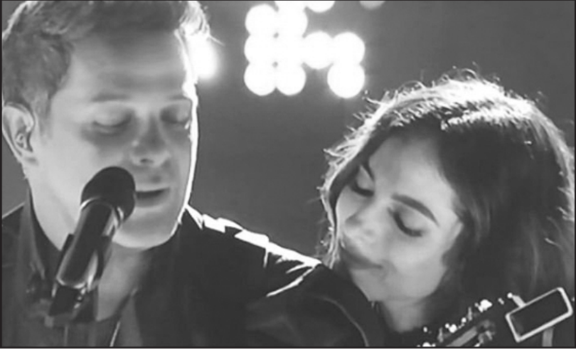
Alejandro Sanz y Paty Cantú

Después del éxito internacional alcanzado con su más reciente CD+DVD titulado #333, la cantautora mexicana PATY CANTÚ, presenta el nuevo video "CUENTA PENDIENTE", un tema en coautoría con uno de los más grandes de la música: Alejandro Sanz.