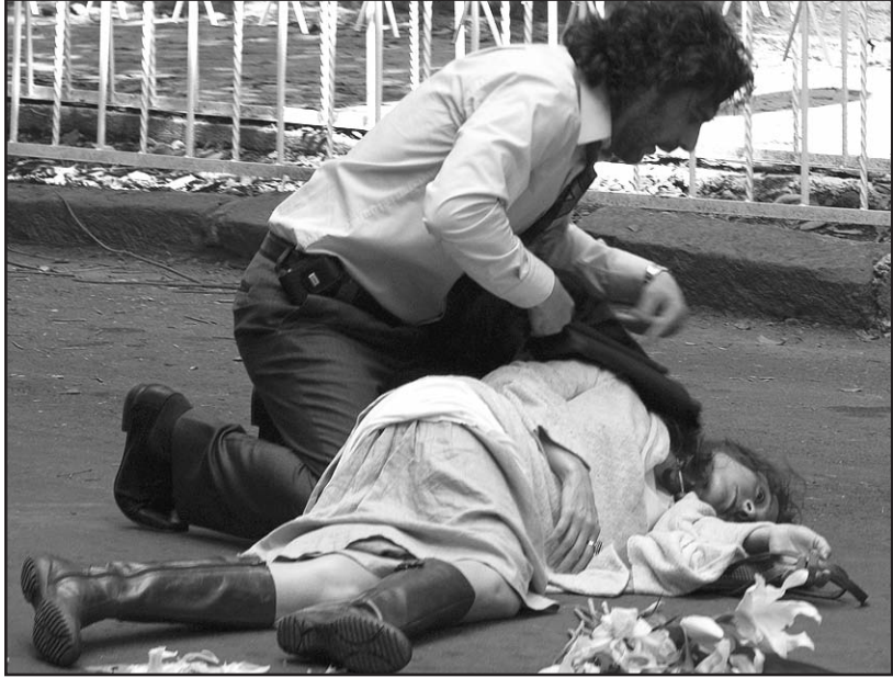
Barbara Mori yace moribunda en una escena de Amor, dolor y viceversa con Leonardo Sbaraglia.

Mezclar sueños y realidad puede ser peligroso. Consuelo lleva casi un año obsesionada con un hombre que la visita en sus sueños, un príncipe azul que, según sus amigos, no existe. Ricardo lleva meses sufriendo pesadillas en las que una desconocida trata de matarle. Poco a poco, el mundo onírico invade la realidad y se encuentran casualmen-