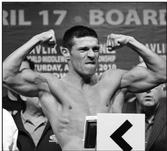
Sergio "Maravilla" Martinez

(36-1 (24 nocauts)) y el árbitro paró la pelea en el octavo asalto cuando