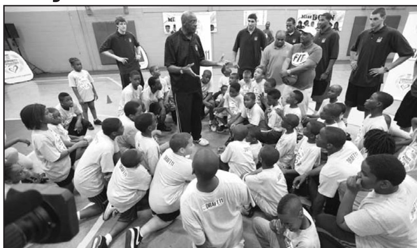
que ha visitado más de 10,000 escuelas donde han marcado una gran diferencia en las vidas de más de 15 millones de fanáticos. Las nuevas y futuras estrellas del NBA enseñaron a los niños las destrezas básicas del juego e incluyeron un curso de obstáculos llamado Let's Move Fitness Obstacle. En la foto aparecen los jugadores con el NBA Hall of Famer Bob Lanier, al centro, dirigiéndose a los niños. El programa es auspiciado por Kia Motors.

Jugadores estrellas del NBA (National Basketball Association) Eries Kanter, Jonas Valanciunas, Jan Vesely, Kawhi Leonard, Tristan Thompson y Alec Burks, dirigidos por el "Hall of Famer" Bob Lanier, y embajador de NBA Cares ofrecieron su día para llevar la clínica de baloncesto a los niños de Newark titulada FIT Clinic. El evento que contó con la participación de 80 niños tuvo lugar en el Boys & Girls Club de Newark, en el 1 de Avon Avenue, en dicha ciudad. FIT Clinic es parte del programa llamado NBA Cares Community Carvan,