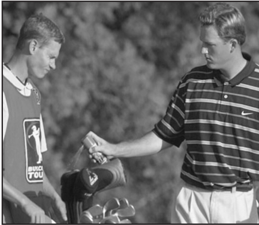
Es indispensable protegerse de las picaduras de garrapatas.

La enfermedad de Lyme es la enfermedad más común transmitida por garrapatas en Estados Unidos. De momento se estiman unos 300 mil nuevos casos al año, aproximadamente