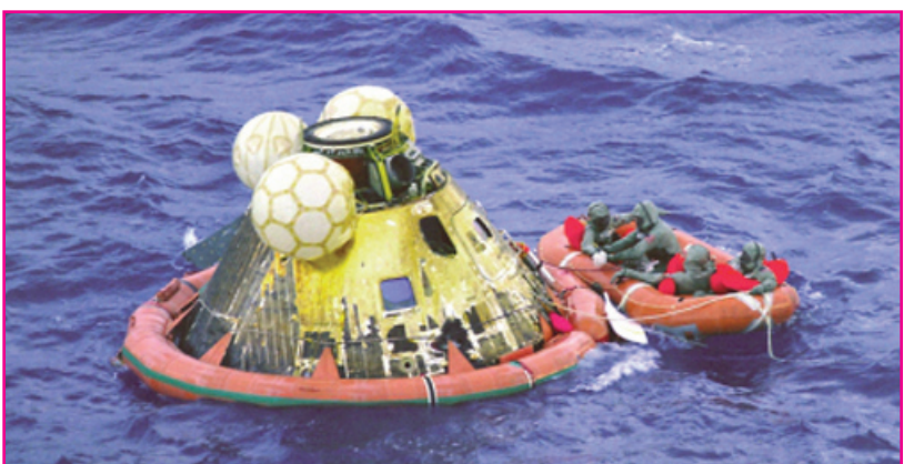
Amarizaje de la cápsula del Apolo XI en el Océano Pacífico.

(Viene de la Página 2) La tripulación del portaaviones USS Hornet, un veterano de la Segunda Guerra Mundial, recogía a los astronautas el 24 de julio de 1969, exactamente 8 días, 3 horas, 18 minutos y 35 segundos des-