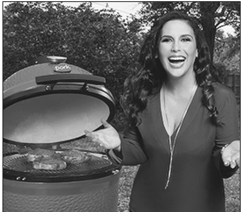
La actriz Angélica Vale, vocera de National Pork Board.

Al llegar el día de los padres, se presenta una ocasión perfecta para una parrillada de verano con la familia. Entonces, le quería compartir una receta deliciosa de la nueva campaña del National Pork Board, ¡Prende el Sabor! Con la ayuda de la reconocida actriz mexicana, comediente y cantante Angélica Vale, el National Pork Board está promoviendo la carne de cerdo como un elemento sano y sabroso de las parrilladas. La campaña demuestra el sabor que le da la carne de cerdo a cada plato a través de una serie de mini videos donde aparece la animada parrilla llamada "Gloria" con la voz de Angélica Vale.