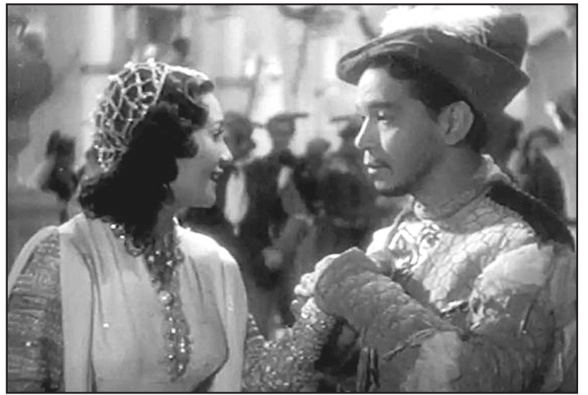
Mario Moreno (Cantinflas) y Maria Elena Márquez en una escena de Romeo y Julieta.

Bueno, si sigo hablando de esas grandes luminarias, nunca he de terminar lo que quiero