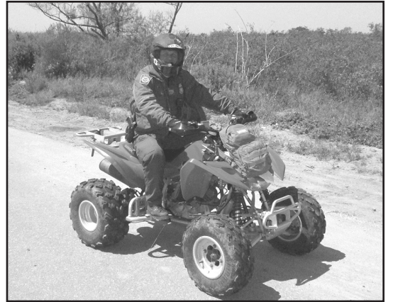
Mi amigo, el patrullero fronterizo trabajando en su vehículo.

preguntas dado que él era el primer guardia fronterizo con el cual yo había hablado en veinte años. “Seguro”, contestó.