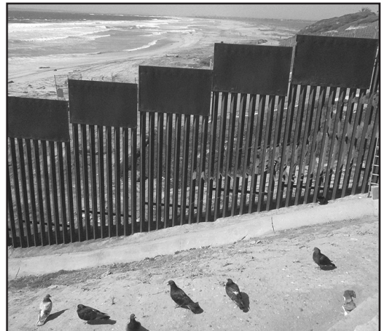
La cerca fronteriza del lado mejicano, mirando al norte, hacia San Diego

Las cercas pueden impedir el cruce de vehículos, pero no de personas. Ese encargo lo tenía el joven patrullero si saltaban la cerca. En la década de los 90, hasta diez mil personas diarias cruzaban la frontera ilegalmente noche tras noche. El dice que ya no hay tantos. Los días de ajeteo en a frontera son historia.