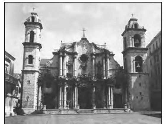
A las 4 de la tarde del glorioso 20 de Mayo de 1902 se celebró en la Santa Iglesia Catedral de La Habana el solemne Te Deum, al que asistió el primer Presidente de la República de Cuba Don Tomás Estrada Palma.