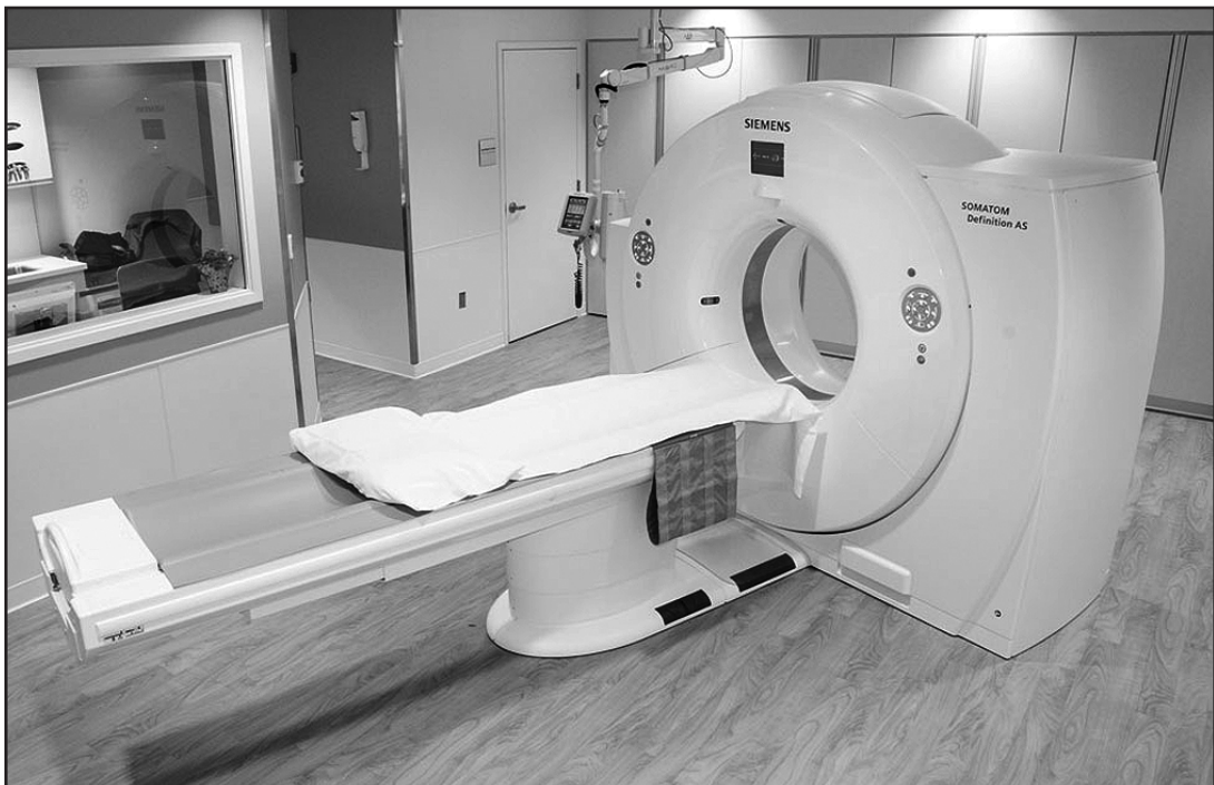
El nuevo CT Scanner instalado en Trintas Regional Medical Center.

Elizabeth, NJ.- Para satisfacer la creciente demanda de atención de emergencia, el Trintas Regional Medical Center, ha completado la primera de tres fases del proyecto de renovación y expansión de su Dpto de Emergencias en existencia. Comenzado en el 2015, el proyecto de $18 millones espera ser terminado en el 2017.