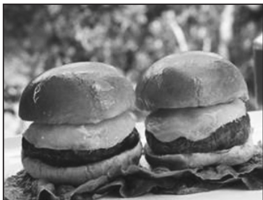
Para recetas: visite mielpura.org