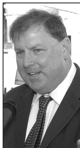
Joe Cryan, el Sheriff del Condado de Union, y candidato a senador por el distrito 20

"Cuando me desempeñé como miembro de la Asamblea de New Jersey, el senador Sweeney y yo ocasionalmente no estuvimos de acuerdo a la hora de abordar ciertas políticas, pero esos desacuer-