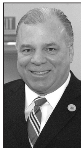
Steve Sweeney, Senador Dist. 3

dos nunca fueron personales y siempre fueron el resultado de un libre intercambio de ideas. El desacuerdo y el compromiso son la base de nuestro gobierno y los diferentes puntos de vista entre los representantes elegidos deben considerarse como un sello de nuestra democracia y no un fracaso para lograr la conformidad".