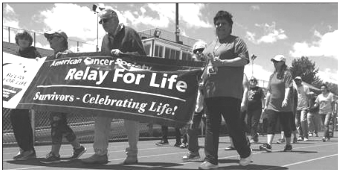
Sobrevivientes, familiares, amigos y cuidadores en el evento Relay for Life 2017. El evento de este año tendrá lugar el sábado 2 de junio en el Track at Union High School ubicado en 2350 N. 3rd Ave Union, NJ 07083.

Municipio de Union – El Municipio de Union presentará la “Carrera de Relevos por la Vida” (Relay for Life) el 2 de junio de 2018 de 11 a.m. a 11 p.m. en la pista del Union High School, ubicada en 2350 N. 3rd St. Union, NJ 07083.