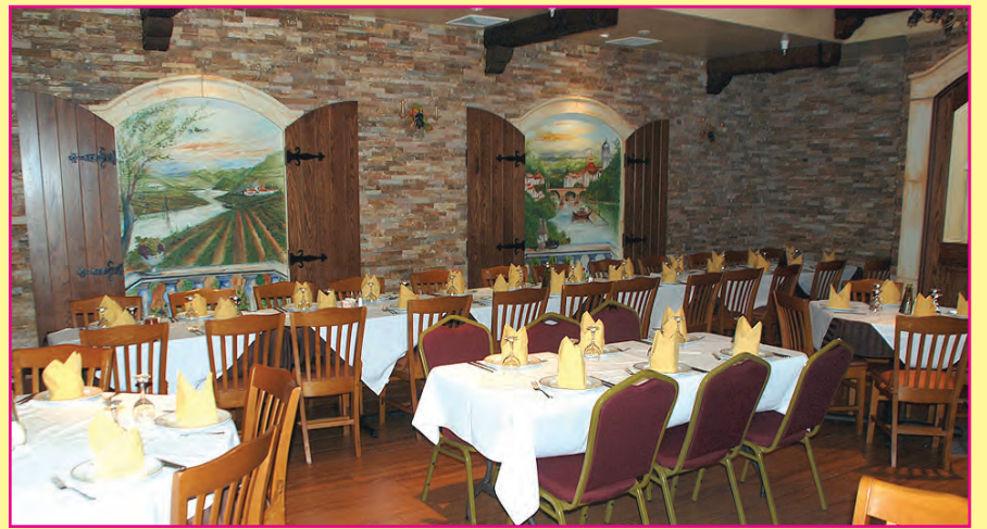
Nuevo Salón Comedor Rústico

Puerquitos Asados a la Perfeccion en Horno de Piedra y Listo en la Caja para Llevar