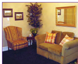
Le servimos tomando en cuenta sus costumbres y deseos.