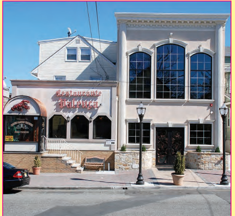
Fachada de Valença Restaurant, Taberna, Grill y Liquor Store, a la derecha el frente del Salón Comedor del Restaurante y el nuevo edificio de los Salones de Fiesta céntricamente localizado en el 665 de Monroe Ave., en la ciudad de Elizabeth, con parqueo valet disponible.