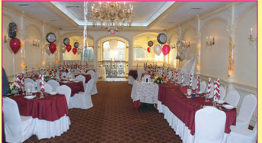
Nuevo Salón para Banquetes, Fiestas y Toda Ocasión

Servimos Fiestas al Aire Libre ó en Nuestros Salones con Capacidad hasta 500 Invitados. Amplio Parqueo Valet