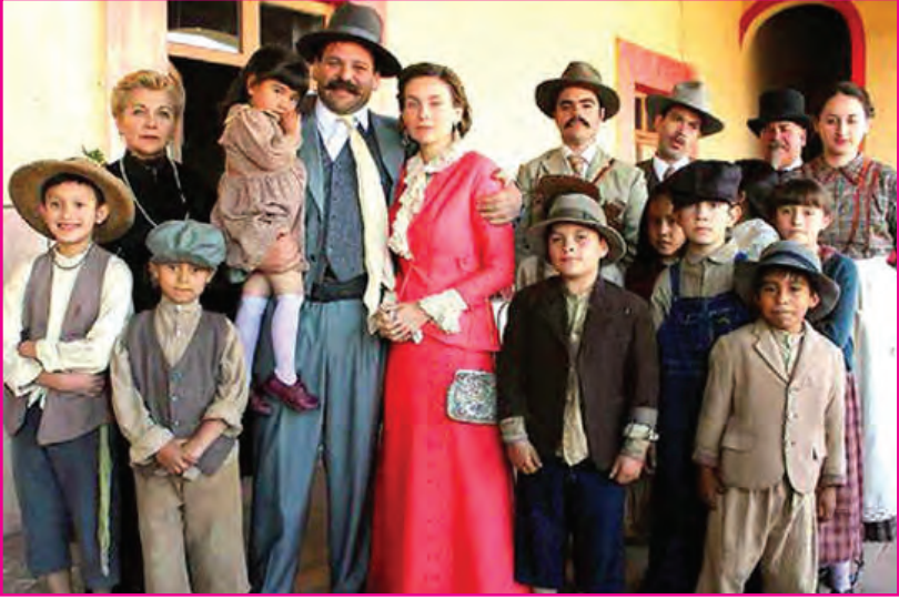
Una escena de "Itinerario de una pasión" en ella Doroteo Arango-Francisco 'Pancho' Villa y familia.

Más allá de que el general fuera a buscar a su Adelita por cielo y por mar, en el campo minado de la Revolución mexicana crecía también el amor y la pasión. Entre balas, caballos y militares, la historia de Doroteo Arango, mejor conocido como Pancho Villa, estuvo llena de celos, intriga y mujeres que buscaban llamar la atención del general. En "Itinerario de una pasión" podrás ver una parte de la historia de este personaje, un héroe de la Revolución pero también un mujeriego que se casó legalmente más de 75 veces. La historia que nadie conoce del general está llena de