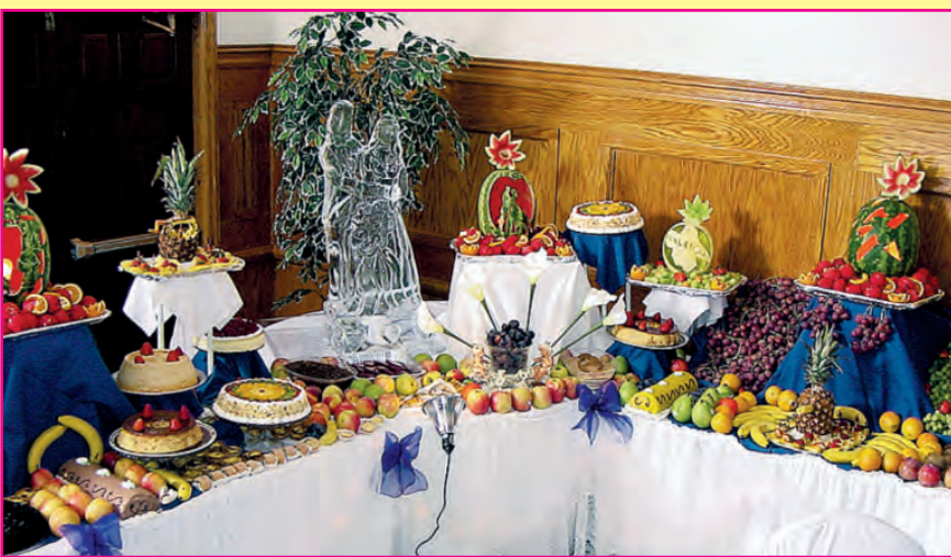
Elaborado Buffet para Satisfacer la Fiesta más Exigente es parte de nuestro servicio de "Catering"