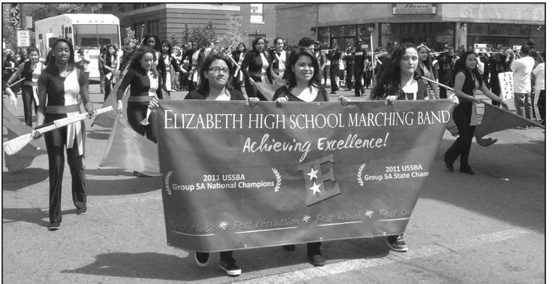
Presentando su banderín, miembros de la banda (Marching Band) mostrando que fueron elegidos campeones nacionales en el grupo 5A en el 2011.