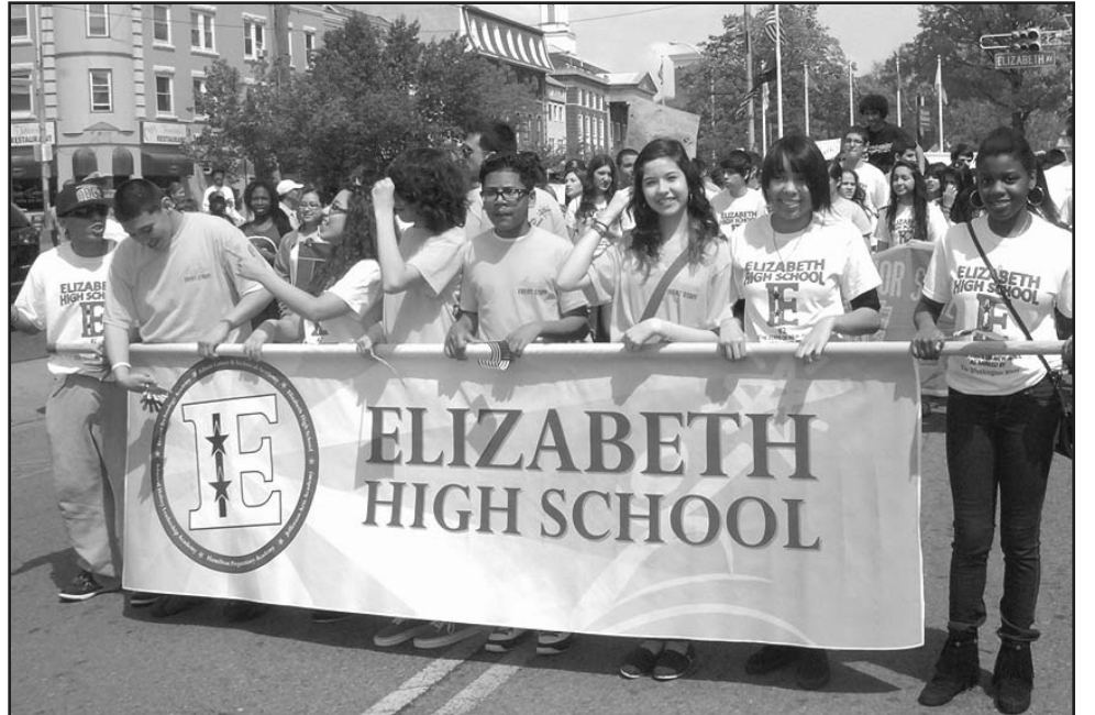
En el Desfile de la Excelencia, Estudiantes de la escuela secundaria Elizabeth High School llevan con orgullo el banderín con el emblema de su escuela.

Elizabeth, N.J., 16 de Abril, 2012 –El Desfile de la Excelencia de las Escuelas Públicas de Elizabeth se realizó el día sábado, 21 de abril del 2012 a las 11:00 am. Los estudiantes de treinta y tres escuelas del distrito participaron en el desfile y estuvieron representados en varias secciones que animaron todo el recorrido del desfile.