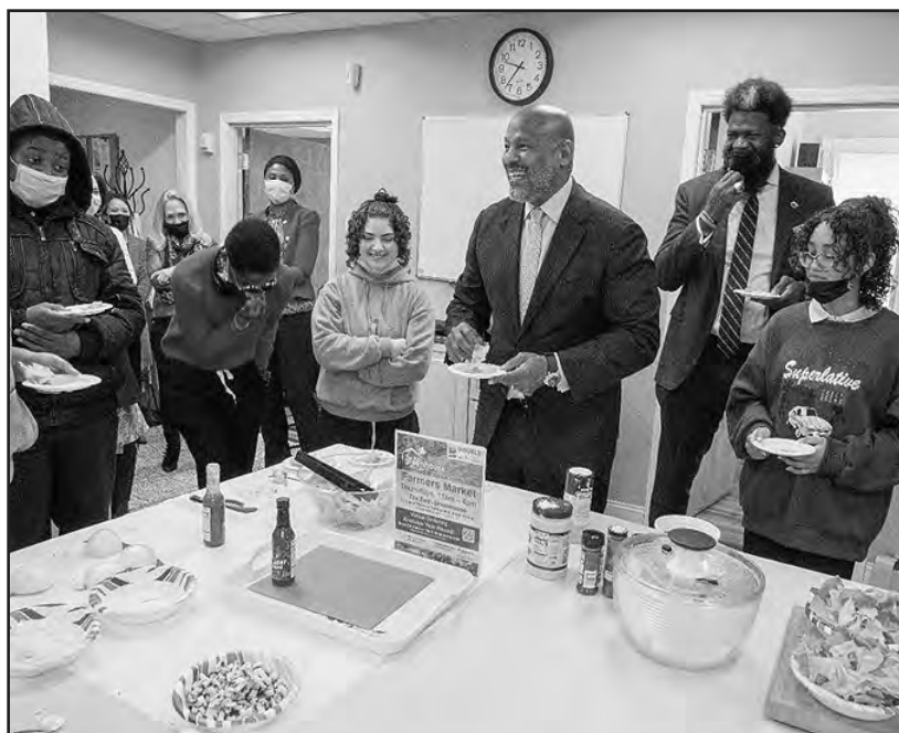
Estudiantes visitan el Centro Comunitario Cristiano de Salud y Bienestar “Reverendo Dr. Ronald B.” (Foto cortesía de RWJBarnabas Health).

“El Beth Greenhouse Farmers Market ofrece frutas y verduras frescas a los residentes de Newark, y el Christian Community Health