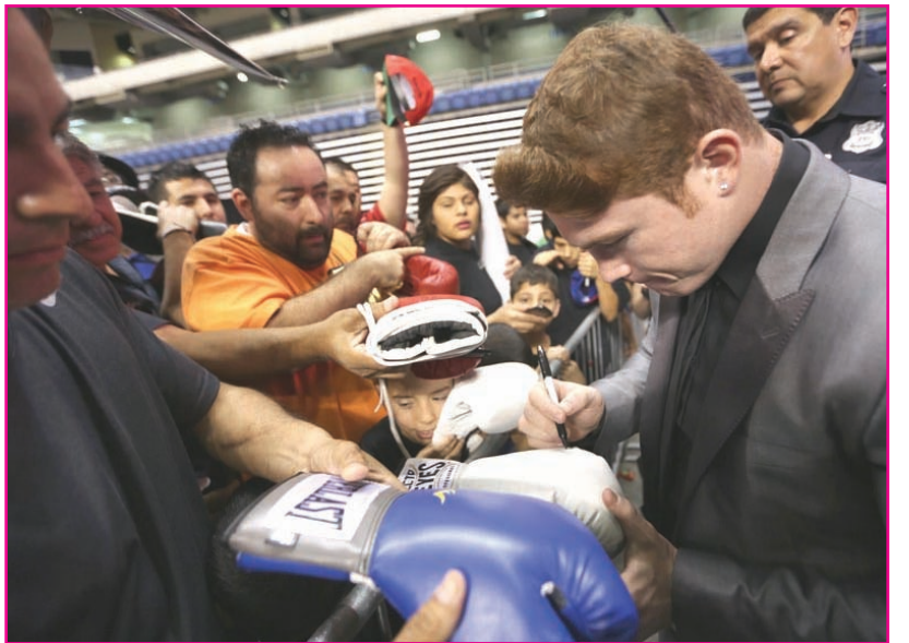
Canelo Álvarez obsequiando autógrafos a la fanática durante la conferencia de prensa preliminar a la pelea.

realidad asistieron a tres conferencias de prensa que formaban parte de su gira promocional.