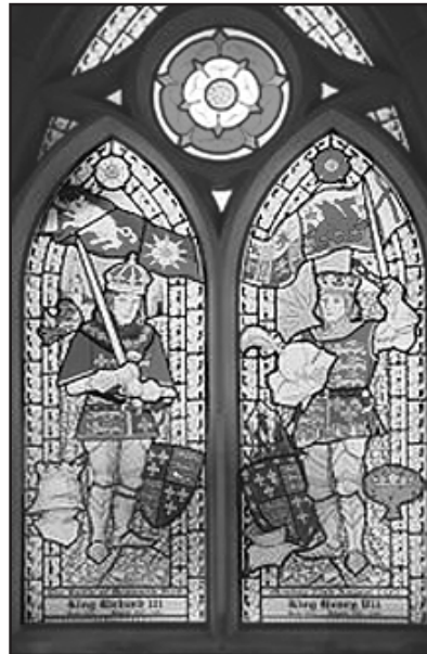
Vitral en la Iglesia St. James-Ricardo a la izquierda y Enrique a la derecha.

Ya era tarde. Ningún caballo aparecía, ...y Ricardo murió de nueve heridas en el cráneo en la histórica Batalla de Bosworth Field reclamando por un animal a cambio de ofrecer si tan valiosa posesión: su reino.