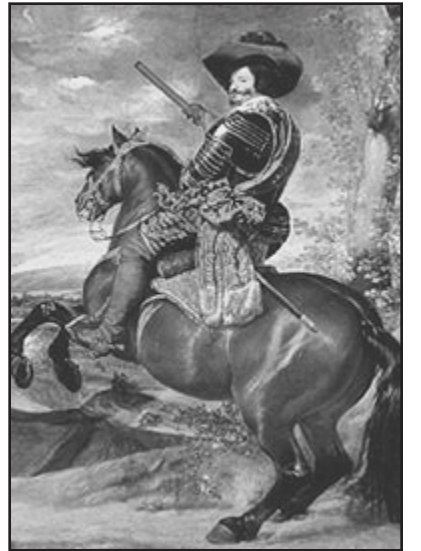
Pintura de Ricardo III a caballo

El sirviente asustado por la orden tan estricta que había recibido urgió al herrero preparar al equino. El pobre herrero con una sola barra de hierro moldeó las cuatro herraduras y presuroso las clavo en los cascos del caballo. Pero, al llegar a la cuarta pata del animal el herrero advirtió que le faltaba un clavo para completar su labor. Ante lo urgente del momento y para salir airoso ante la cólera del rey, arregló el problema lo