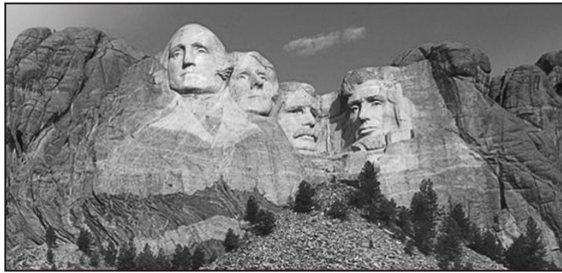
El Monumento de "Mount Rushmore National Memorial" en South Dakota, donde aparecen los presidentes George Washington (1732-1799), Thomas Jefferson (1743-1826), Theodore Roosevelt (1858-1919) and Abraham Lincoln (1809-1865).

Este día conocido como Día de los Presidentes se originó porque en anteriores años en 1880 el Congreso lo había adoptado feriado para las oficinas federales en el distrito de Columbia, como el Día de George Washington, primer presidente de Estados Unidos, quien cumplía su natalicio el 22 de febrero. Años mas