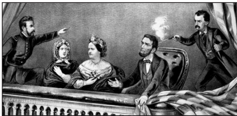
Litografía del asesinato de Abraham Lincoln, publicada por Currier & Ives en 1865 En el palco se encuentran de izquierda a derecha: Major Henry Rathbone, Clara Harris, Mary Todd Lincoln, Abraham Lincoln, y John Wilkes Booth, el asesino.

Lincoln ha sido el primer presidente asesinado mientras ocupaba su cargo.