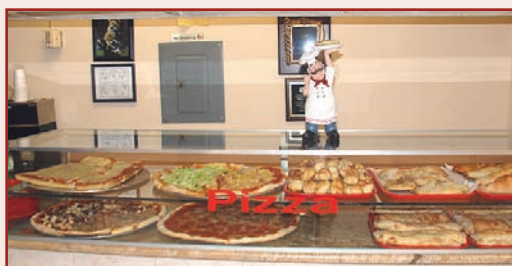
La Mayor y Mejor Variedad de Pizza

Antiguamente Elin's Pizza, ahora Completamente Remodelado Sirviendo a la Comunidad por 32 Años.