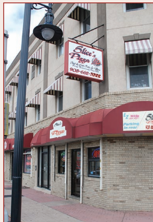
En la esquina de 7th St. y Elizabeth Ave.