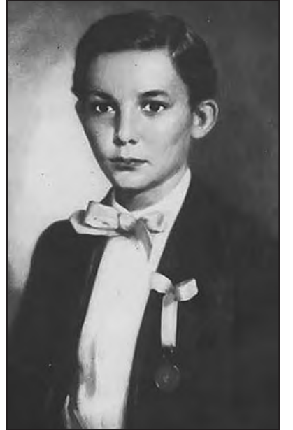
José Martí de niño

Cesanteado de nuevo el padre, su honradez no transigía con la falta de moral administrativa en la colonia, se dirige en busca de trabajo a Honduras Británica, y a pesar de las protestas de Doña Leonor para no interrumpir de nuevo los estudios de Pepe, lo lleva con él. Al regreso su