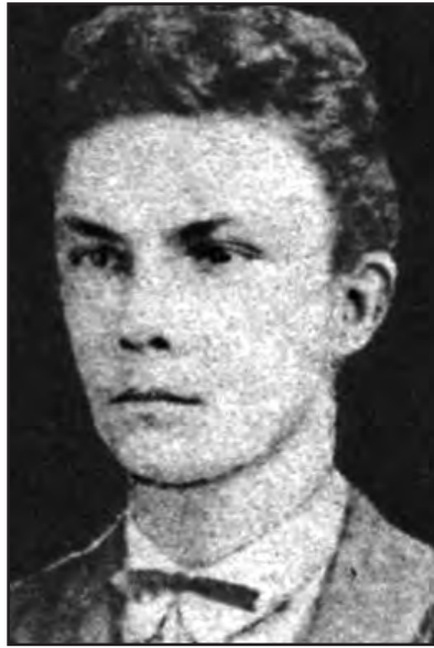
José Martí a los 16 años

José Julián Martí y Pérez nació en una modesta casa, en la calle Paula No.102, en la ciudad de San Cristóbal de la Habana, el 28 de Enero de 1853. Su padre, Mariano Martí y Navarro, natural de Valencia, España, hombre sencillo, leal, honrado, de porte mili-