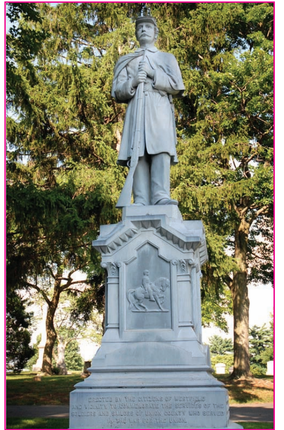
Monumento de la Guerra Civil en el Cementerio Fairview en la ciudad de Westfield, "Erigido por los ciudadanos de Westfield y alrededores para conmemorar los servicios de los soldados y marineros del Condado de Union que prestaron servicio durante la Guerra," (Foto Jim Lowney Condado de Union).

Las alumnas de la Benedictine Academy coinciden con los representantes de la JTB Foundation en que la ley debe ser actualizada porque "la tecnología ha avanzado tanto que ahora hasta un alumno