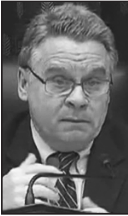
Cong. Chris Smith

El representante católico Chris Smith ha trabajado en el movimiento pro-vida durante casi medio siglo, logrando gran parte de ese trabajo en el Congreso, luchando por las protecciones legislativas para los no nacidos.