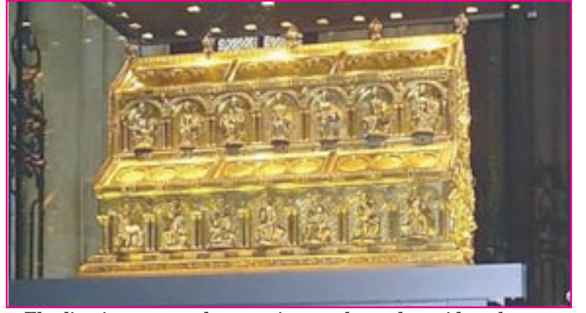
El relicario mas grande que existe en el mundo occidental-

Los Magos son citados en la Biblia, -en el Nuevo Testamento-, y lo que se lee con devoción en el Evangelio de Mateo.