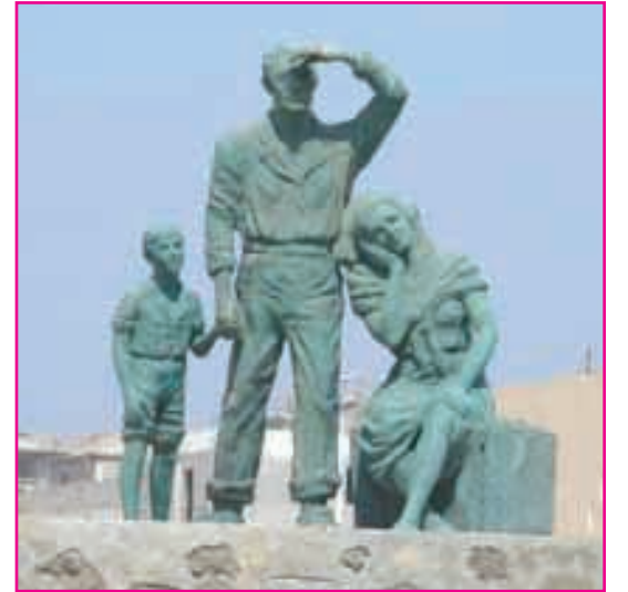
Escultura al Emigrante- Obra de Thelvia Marin Mederos, natural de Cuba. Conjunto situado en La Rotonda, entrada a La Garita, Parque Nacional del Teide, en el centro geográfico de la isla de Tenerife. Uno de los parajes mas importantes del mundo.

Así fue como la Asamblea General de la ONU declaró esa fecha y aprobó una convención para proteger los derechos de las personas que vivían y viven fuera de sus países de origen. La proclamación de este día -se dijo en aquel momento- se debía al motivo de asegurar el respeto de sus derechos y libertades fundamentales. El Día Internacional del Migrante fue originalmente proclamado el 4 de