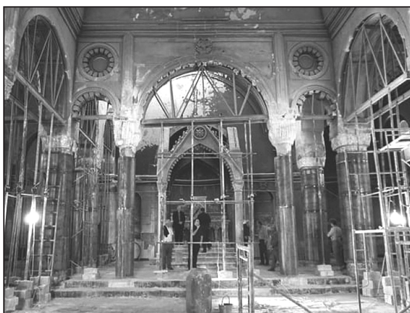
Catedral de la Inmaculada Concepción de Al-Tahira en Bakhdida, Iraq

La catedral en las llanuras de Nínive de Iraq fue construida entre 1932 y 1948, por los granjeros católicos que donaban cada año de su cosecha, explicó el sacerdote. El Gran Al-Tahira sirvió a una comunidad cristiana en crecimiento, hasta que el Estado Islámico convirtió la